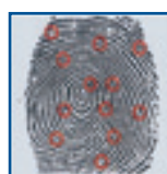
Points caractéristiques repérés par le logiciel appelés "Minuties"