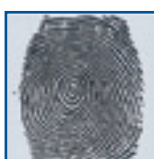
Image de l'empreinte lue par le capteur